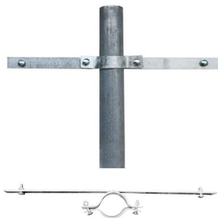
Conjunto para fixação das placas de sinalização